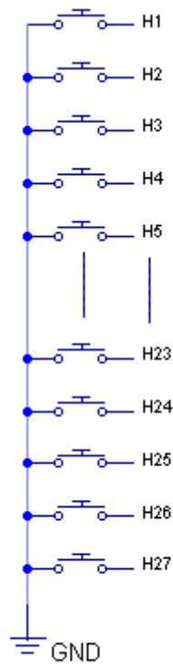
SET - RESET

El común de LUCES son los pines 35, 36 y 37.